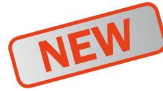
Shadow 102 ATM