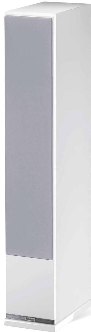
Piano Weiß/ Weiß Dekor