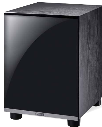
Shadow Sub 300A