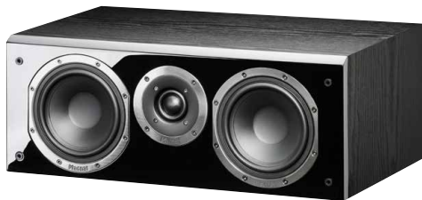
Shadow Center 213