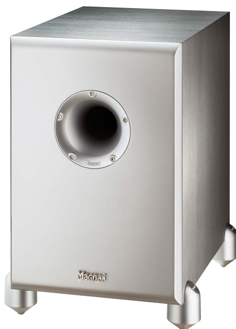
Silber (nur 20A)